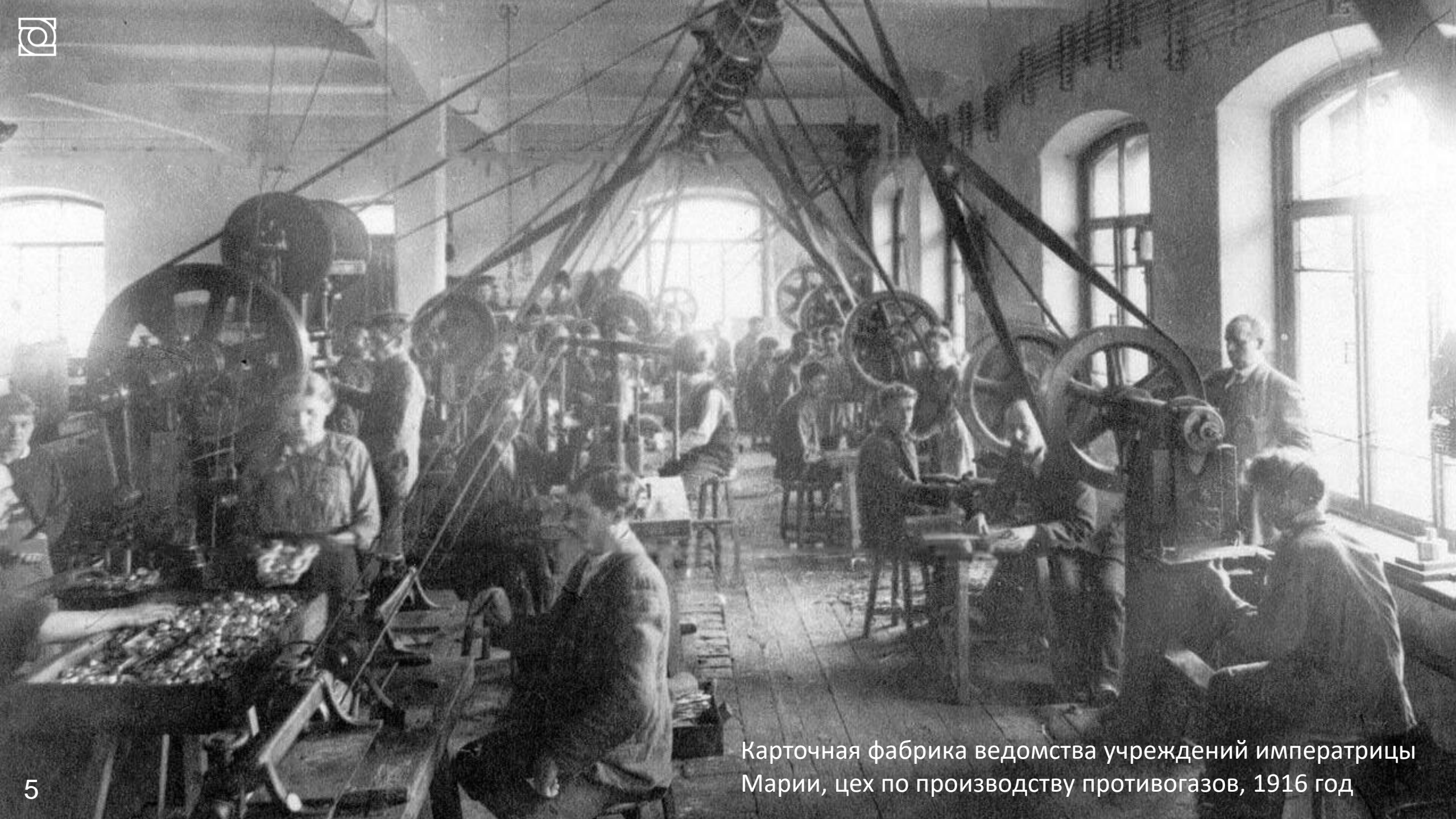
Карточная фабрика ведомства учреждений императрицы Марии, цех по производству противогозов, 1916 год